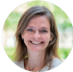
Markéta Růžičková Tiskové oddělení

Pracovištěm AV ČR pomůžeme v profesionální komunikaci s médii. Poradíme, jak určité téma, výsledek vědecké práce nebo osobnost prezentovat médiím. Pomůžeme s kompletní přípravou a distribucí tiskových zpráv. Poradíme s efektivním sestavením mediálního mixu. Pravidelně komunikujeme s novináři.